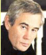
Réalisateur S. Bodrov